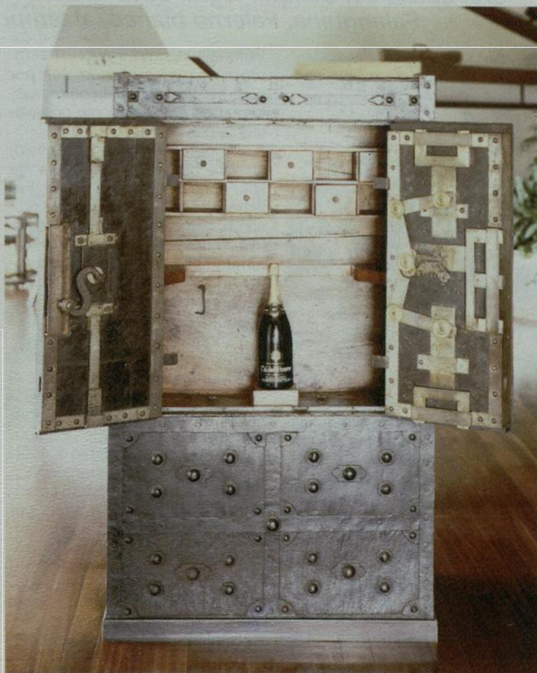
A destra: Un gioiello in cassaforte, lo spumante Brut.