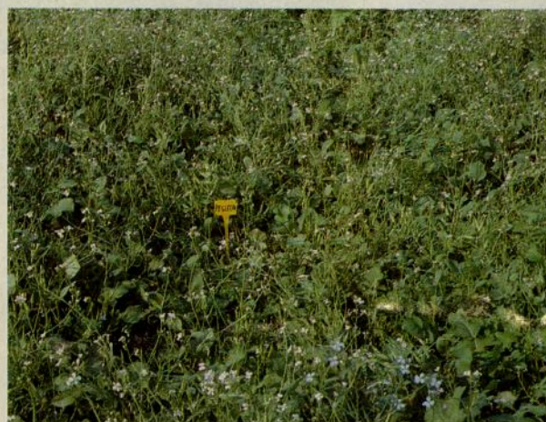
Fig. 2 - Pianta di Raphanus sativus spp. oleiformis (cv. Pegletta).

In avvicendamenti quadriennali (frumento-mais-frumento-barbabietola da zucchero) con colture intercalari di Raphanus