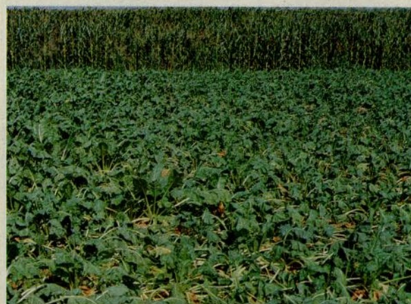
Fig. 3 - Effetto della coltura intercalare di Raphanus sativus spp. oleiformis (cv. Pegletta) sullo sviluppo vegetativo della barbabietola da zucchero coltivata in rotazioni quadriennali con o senza l'intercalare di Pegletta.

L'autore è dell'Osservatorio malattie delle piante della Regione Emilia-Romagna.