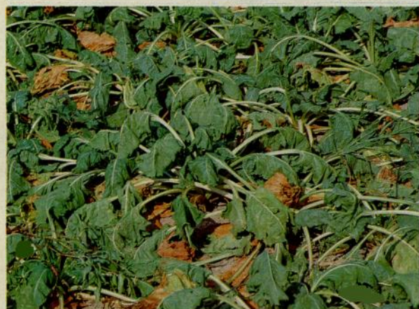
Fig. 1 - Pianta di barbabietola da zucchero con appassimento fogliare determinato da Heterodera schachtii .