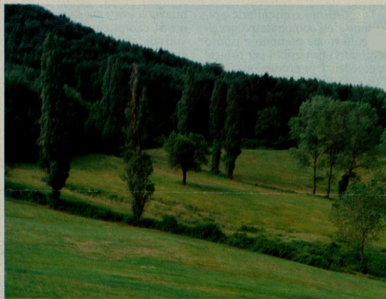
Fare set aside significa tenere a riposo i terreni agricoli.

All'emergenza delle piante si raccomanda di intervenire con tempestività con un trattamento insetticida se si notano erosioni da insetti ( Altica e Athalia colibri ) sulle giovani foglie poiché un loro attacco molto forte potrebbe comprometterne lo sviluppo. È altresì consigliabile, in funzione set aside, sfalciare queste piante dopo circa 50 giorni dalla semina per evitare la deiezione dei semi che provocherebbero un inerbimento difficile da controllare e