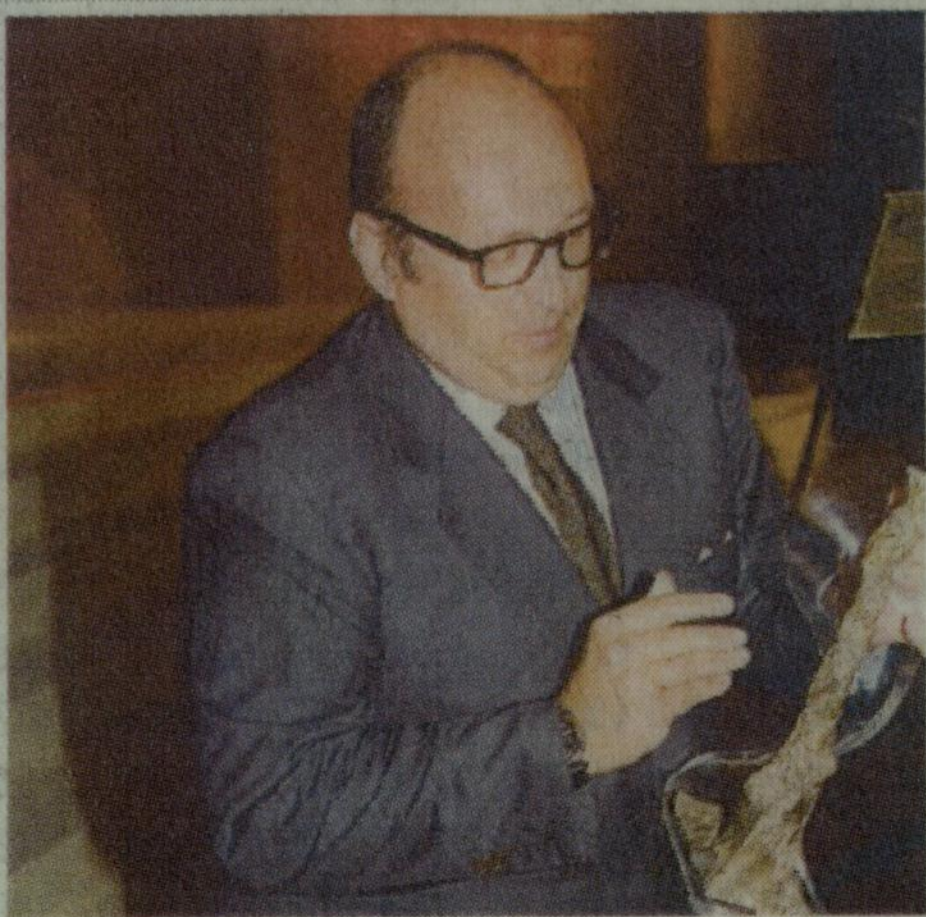
Zanella con Cà del Bosco ha battuto i francesi