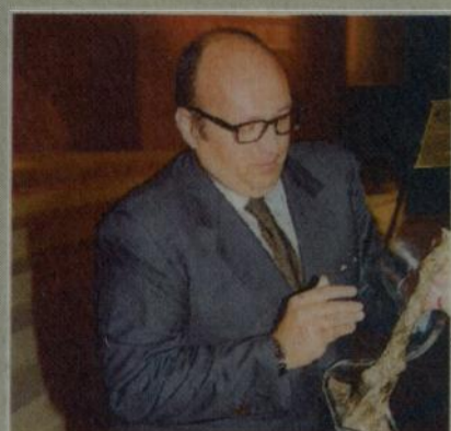
Zanella con Cà del Bosco ha battuto i francesi