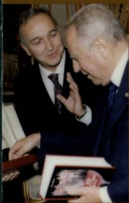
Le Città del vino in visita da Ciampi