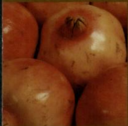
Le simbologie della melagrana

VIAGGIARE, BERE, MANGIARE, VIVERE MEGLIO