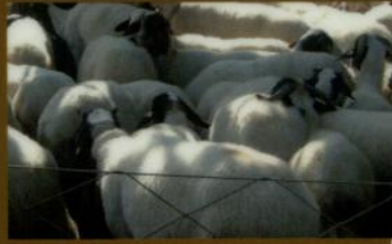
• I formaggi della costiera amalfitana