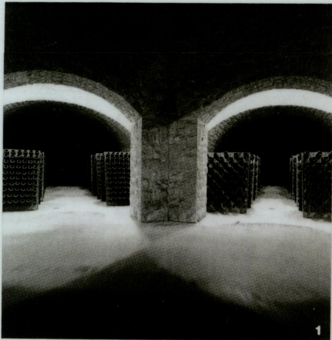
1. Fotografia di Mimmo Jodice, dal volume 11 fotografi 1 vino.