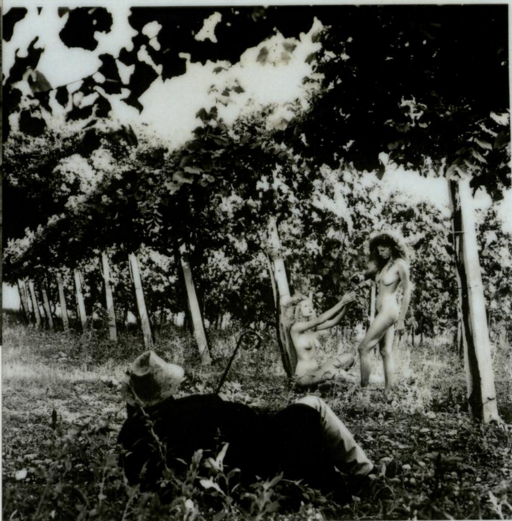
Un'opera di Helmut Newton e, nella pagina a lato, di Franco Fontana

Dopo Newton altri dieci fra i più grandi fotografi del mondo avevano scandagliato l'anima della Ca' del bosco e di Maurizio Zanella e dei vini e degli uomini dell'azienda e della Franciacorta dando vita ad un polittico formato da 171 tavole rigorosamente in bianco e nero.