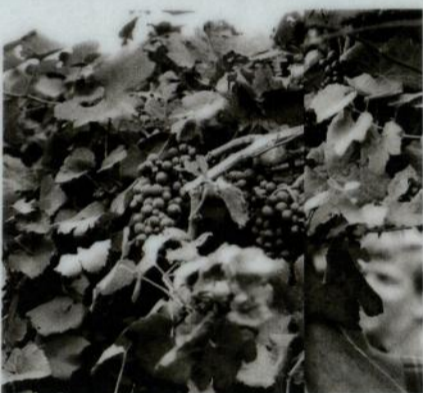
Immagini da/pictures from "11 fotografi per 1 vino".