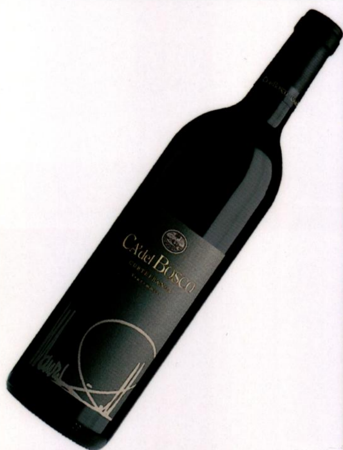
VINI ITALIANI 2006 1500 migliori e più convenienti