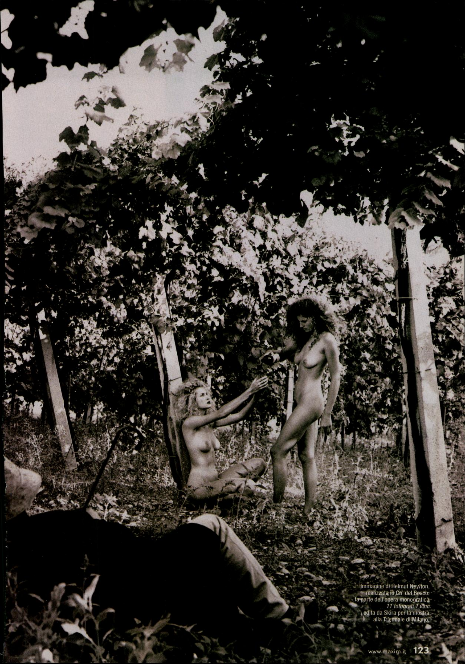
Immagine di Helmut Newton, realizzata in Ca' del Bosco: fa parte dell'opera monografica 11 fotografi. 1 vino , edita da Skira per la mostra alla Triennale di Milano.