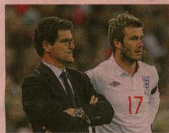
Fabio Capello e David Beckham

◈ Com'è Beckham? «Importante». Importante, nel linguaggio cauto di Fabio Capello, può voler dire indispensabile: tenuto in panchina per più di un tempo, il milanista è entrato in campo a Wembley accompagnato dalla consueta ovazione. I tifosi dell'Inghilterra amano l'ex capitano ritrovato. E il duro Capello, sulla panchina dell'Inghilterra come su quella del Madrid, capisce quanto sia utile averlo con sé.