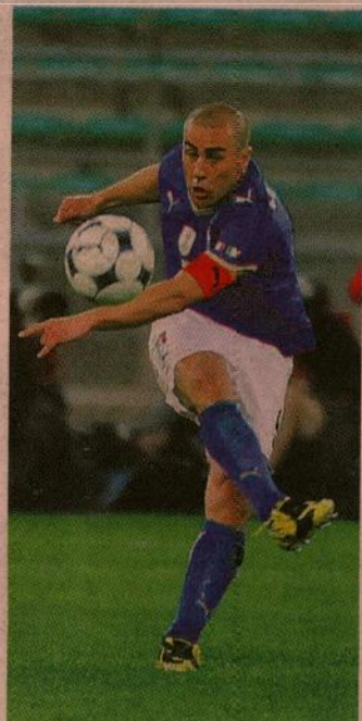
Fabio Cannavaro, 35 anni PIPITA

Cannavaro replica a De Laurentiis: «A quanti anni hanno smesso Baresi, Maldini, Ferrara?»