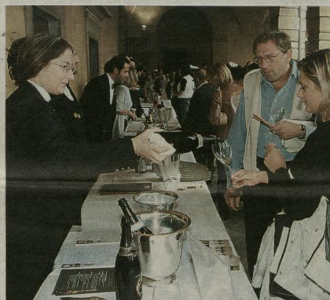
Un momento delle degustazioni del Festival franciacortino

A Villa Lechi, sede storica della manifestazione, si aggiunge Casa Marchetti