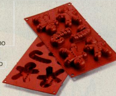
SF 106 mm 94 x 78 x h 21