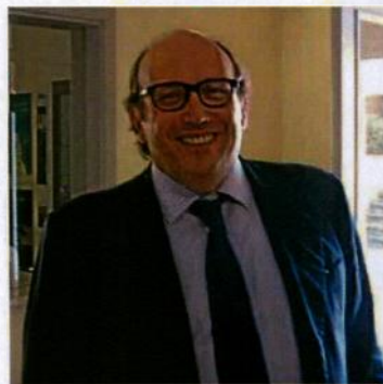
Il presidente Maurizio Zanella

Il Franciacorta archivia il 2010 con oltre 10 milioni di bottiglie commercializzate, fra Italia e il mondo, con un incremento del 10% rispetto all'anno precedente. «Siamo orgogliosi di aver superato questa soglia, che non è solo simbolica - sottolinea Maurizio Zanella, presidente del Consorzio di tutela - nonostante la crescita quantitativa sia stata sempre un obiettivo decisamente secondario rispetto all'incremento qualitativo medio della produzione». A questo si aggiunge - prosegue Zanella - «la congiuntura economica globale, che anche l'anno scorso, ha visto una ripresa modesta. Nonostante questo,