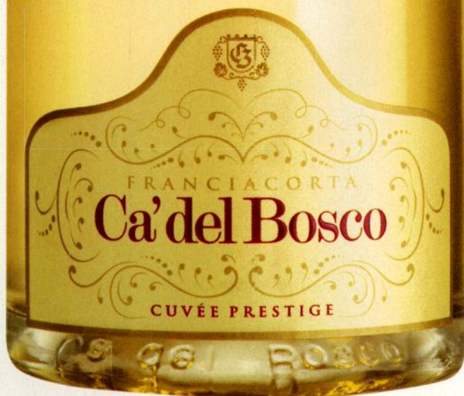
Брют Дома Ca' del Bosco Simple (2)