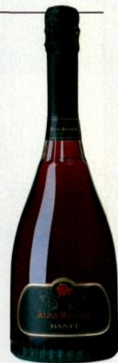
Бракетто Дома Banfi Vinopolis ②

Бракетто д'Акви или просто Акви — немаленький (ок. 1000 га), но не очень известный за пределами Италии апелласьон по игристым винам. Они делаются из уникального красного ароматного сорта бракетто, не обладающего, правда, большим количеством антоцианов. Вина акви получаются скорее розовыми, чем красными. Винификация такая же, как для асти. В аромате преобладают мускатно-клубнично-малиновые тона, что на пару с существенной остаточной сладостью делает бракетто безусловным выбором романтических личностей.