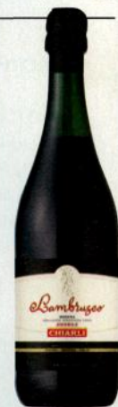
Ламбруско Chiarli Simple ①

Огромный (около 4500 га) апелласьон в Эмилии-Романье производит красное игристое вино (фридзанте) с некоторым количеством остаточного сахара. Благодаря танинам и высокой (несмотря на сахар) кислотности (> 6 г/л), ламбруско отлично сочетается с весьма жирной кухней Эмилии-Романьи, в которой знаменитых продуктов DOP гораздо больше, чем вин де-факто DOC-овского уровня. Ламбруско бывает ещё розовым (в рамках DOC) и белым (только IGT).