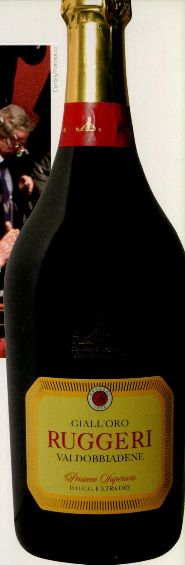
Базовое просекко Дома Ruggieri Simple ①