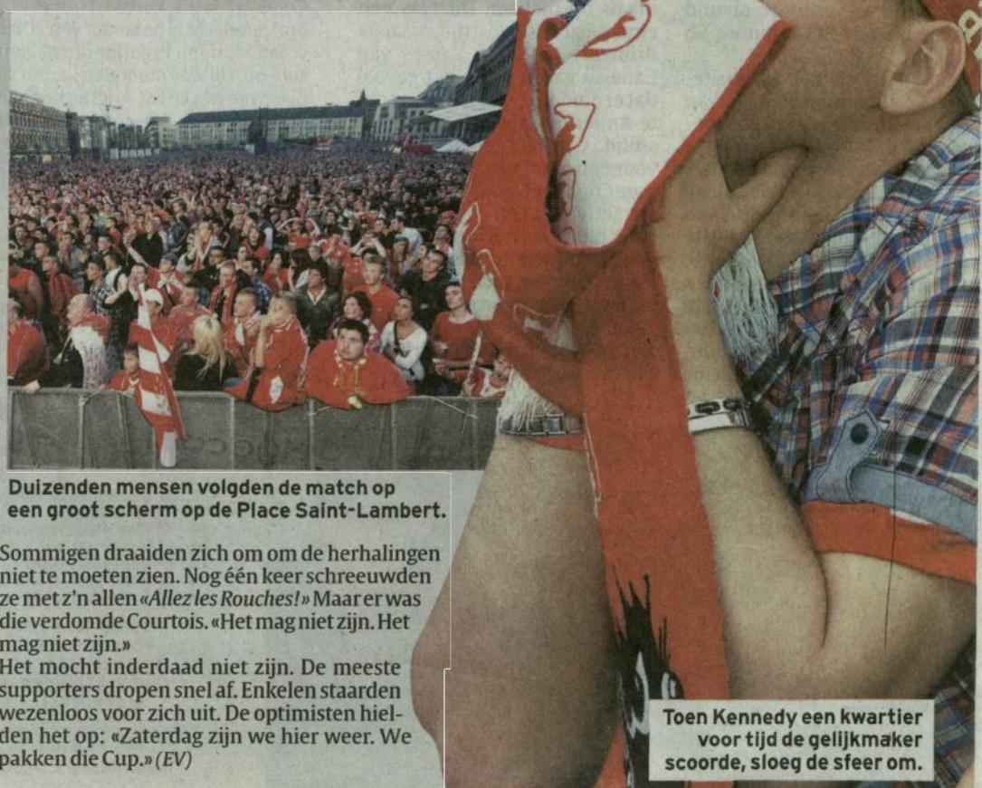
Duizenden mensen volgden de match op een groot scherm op de Place Saint-Lambert.