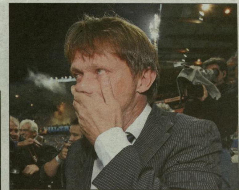
Tot tranen toe bewogen.