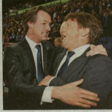
Felicities voor de succestrainer.