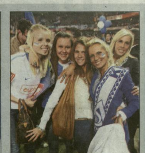
De spelervrouwen feestten mee.