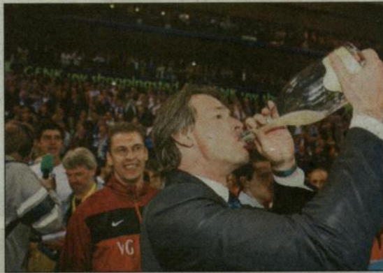
De ontlasting met champagne.