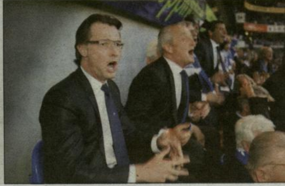
Avond: spanning tot en met op de tribune.