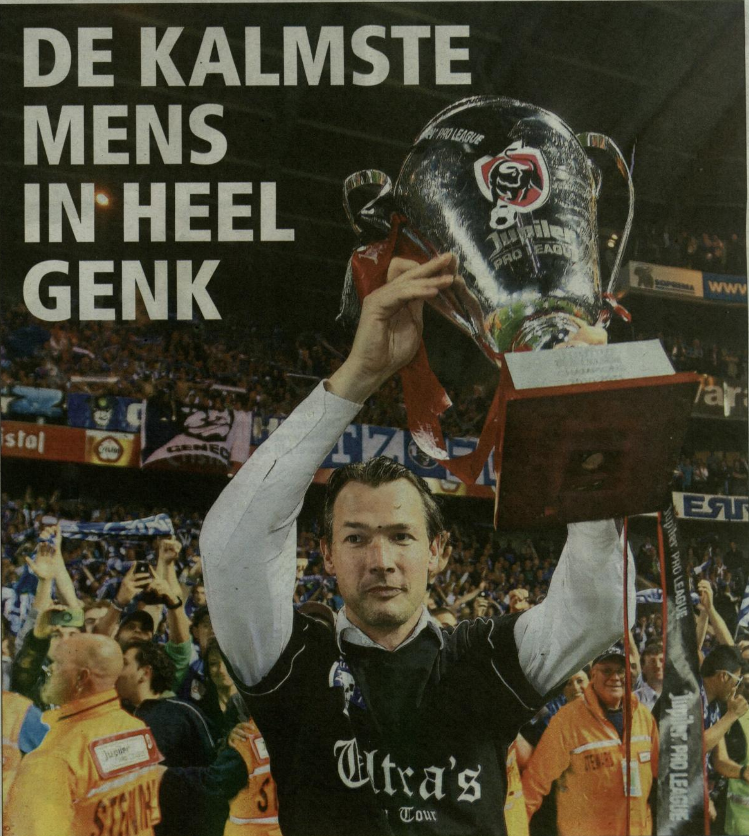
De jongste voorzitter van eerste klasse heeft zijn eerste prijs te pakken.