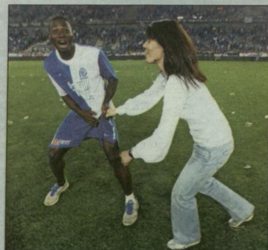
Een vrouwelijke fan wil de broek van Kennedy.