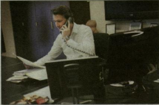
Namiddag: rustig de laatste dossiers afwerken.