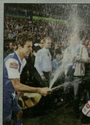
En de champagne vloeide rijklijk...