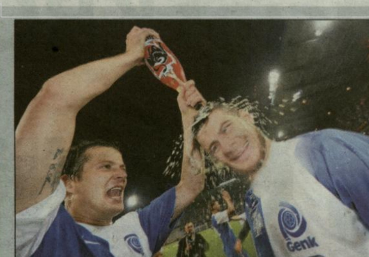
Een bierdouche heet zoiets.