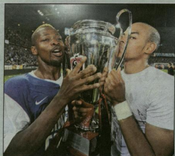
Matoukou en Ogunjimi.