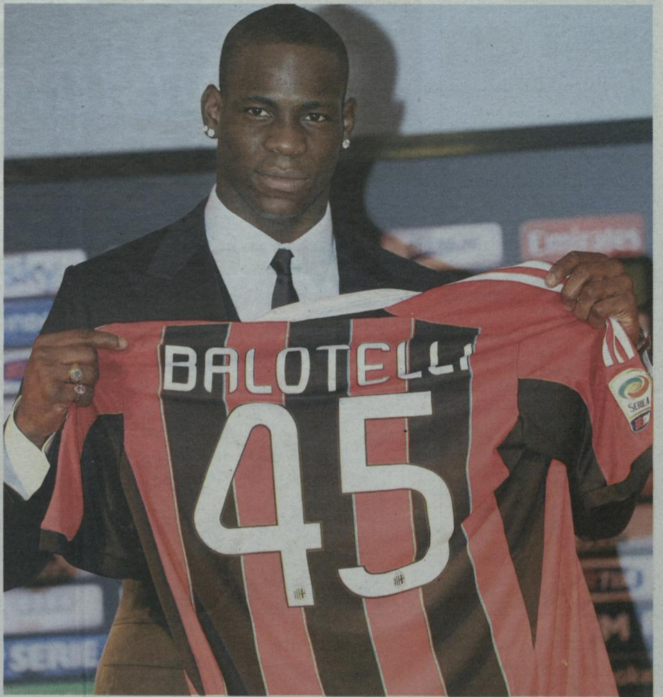
Mario Balotelli: l'attaccante bresciano, 21 anni, approda al Milan dopo aver giocato nel Lumezzane, nell'Inter e nel Manchester City

Sorride, Balotelli, ma sembra inamidato in un vestito che non è il suo. A scioglierlo il video d'apertura, con sottofondo rockeggiante, che parte dal 10 marzo 2010, dal profetico Valerio Staffelli di Striscia la Notizia che gli consegna la maglia rossonera numero 45. Poi le prodezze con il Manchester City e la Nazionale, dell'Inter non c'è traccia se non nell'effigie di Mancini e di Mourinho, unica concessione ai cugini nerazzurri. E alla fine i due gol alla Germania nella semifinale dell'Europeo e il fermoimmagine di Balo che, dopo il 2-0, mostra il fisico scultoreo.