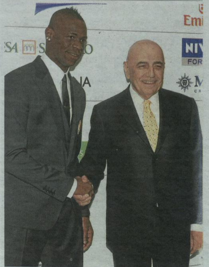
Mario Balotelli con l'ad del Milan Adriano Galliani.

«Domanda carina...», è intervenuto Galliani, piccatissimo, affermando che «Berlusconi non si è scusato, ma ha precisato». «Sono più vecchio di te e capisco le domande», ha spiegato l'ad rossonero rivolto a Balotelli, e alla giornalista ha detto: «Lei ha detto una cosa inesatta, faccia le domande a me». «Non si possono fare solo domande compiacenti. Mi scuso - ha ribattuto ironicamente la giornalista - se ho detto un'inesattezza...». Aggiungendo: «Alle smemorate del presidente siamo abituati anche su altre cose». ● v.c.