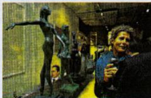
«Larte» in via Manzoni