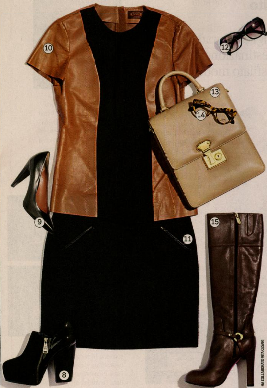
HA COLLABORATO VITA CESARI