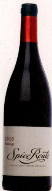
Spice Route Pinotage 2010

Здесь мне почему-то приходит на ум Louis Vuitton, который качественный, надежный, известный, но абсолютно предсказуемый. Я знаю, что с ним будет через десять лет и что было десять лет назад.