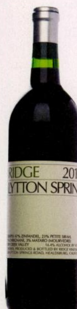
Ridge Lytton Springs 2010

Австралия Яркий представитель недорогих ширазов: спелый, сочный, фруктовый и очень узнаваемый. В послевкусии тона шоколада. Simple (2)