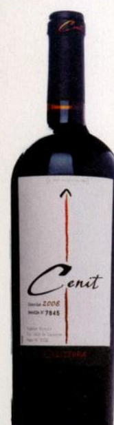
Vina Caliterra Cenit 2008

Калифорния Интересный ассамбляж из зинфанделя, пти сира, нариньяна и мурведра: мягкий, сбалансированный и запоминающийся. Simple (3)