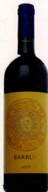
Agricola Punica Barrua 2009

ЮАР Насыщенный цвет и такой же аромат, в котором чувствуются ароматы черных ягод, специй, дуба и земли. Яркое пряное послевкусие. Simple (2)