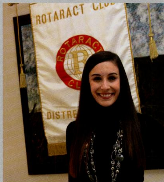
ROTARACT CLUB DISTRETTO 2050 ITALIA