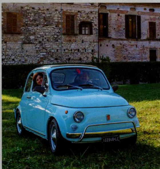
DIMORE IN FRANCIACORTA: PALAZZO TORRI