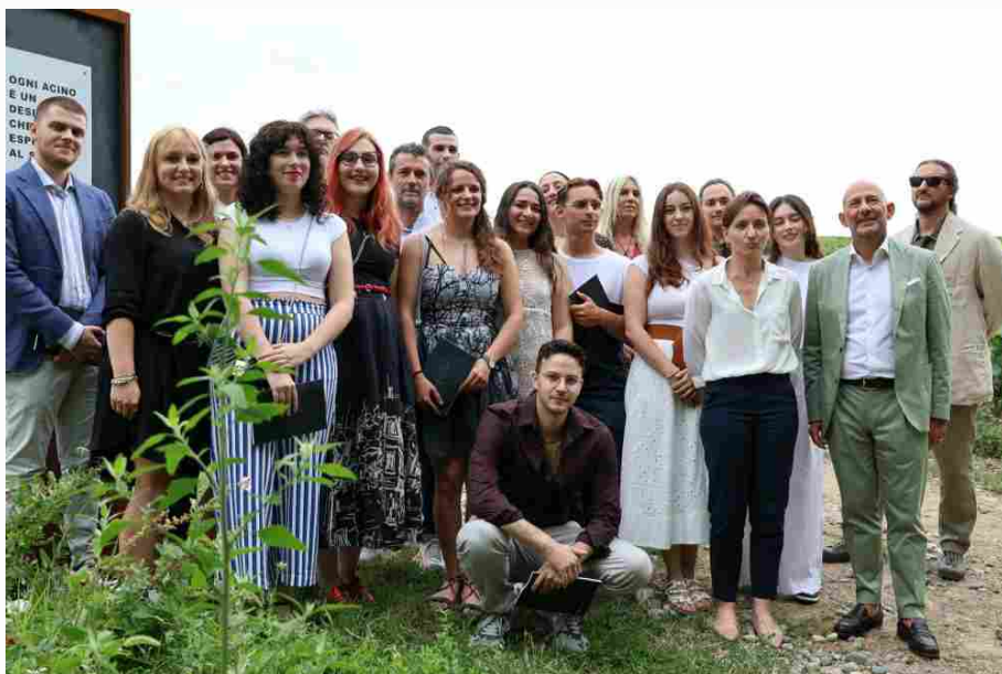
Studenti dell'Accademia di Belle Arti SantaGiulia insieme ai dirigenti di Ca' del Bosco

I 23 totem, che fungono da tele per gli artisti, sono stati realizzati in resistente acciaio corten dall'architetto Gabriele Falconi. Dietro la progettazione c'è un pensiero. L'obiettivo di Ca' del Bosco e di Falconi era di collocarli in zone appositamente studiate, di modo che la gente potesse osservarli dalla strada, stabilendo un contatto immediato. E così è stato. I totem svolgono una funzione informativa, ma soprattutto una rilevanza artistico-culturale.