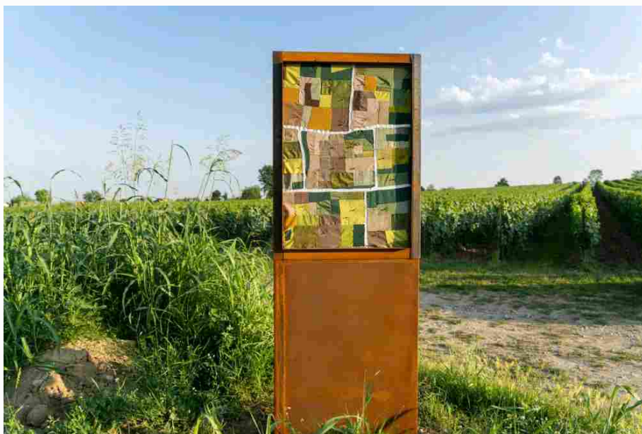
In Vinea di Ester Faustini, Vigneto Castello

Negli spazi della cantina vinicola Ca' del Bosco, territorio della Franciacorta, il nuovo progetto "Arte in Vigna", nato in collaborazione con gli studenti dell'Accademia di Belle Arti Santa Giulia di Brescia, punta a salvaguardare l'ambiente servendosi del linguaggio dell'arte.