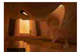
M2 ART CENTRE: AN INVERTED VALLEY TOWARDS INNER JOURNEYS