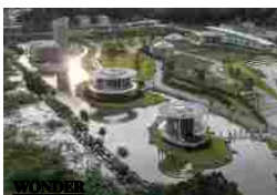
LANDSCAPE DESIGN FOR HONGHU PARK WATER PURIFICATION STATION