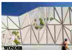
ESCALERAS Y MIRADOR VELA