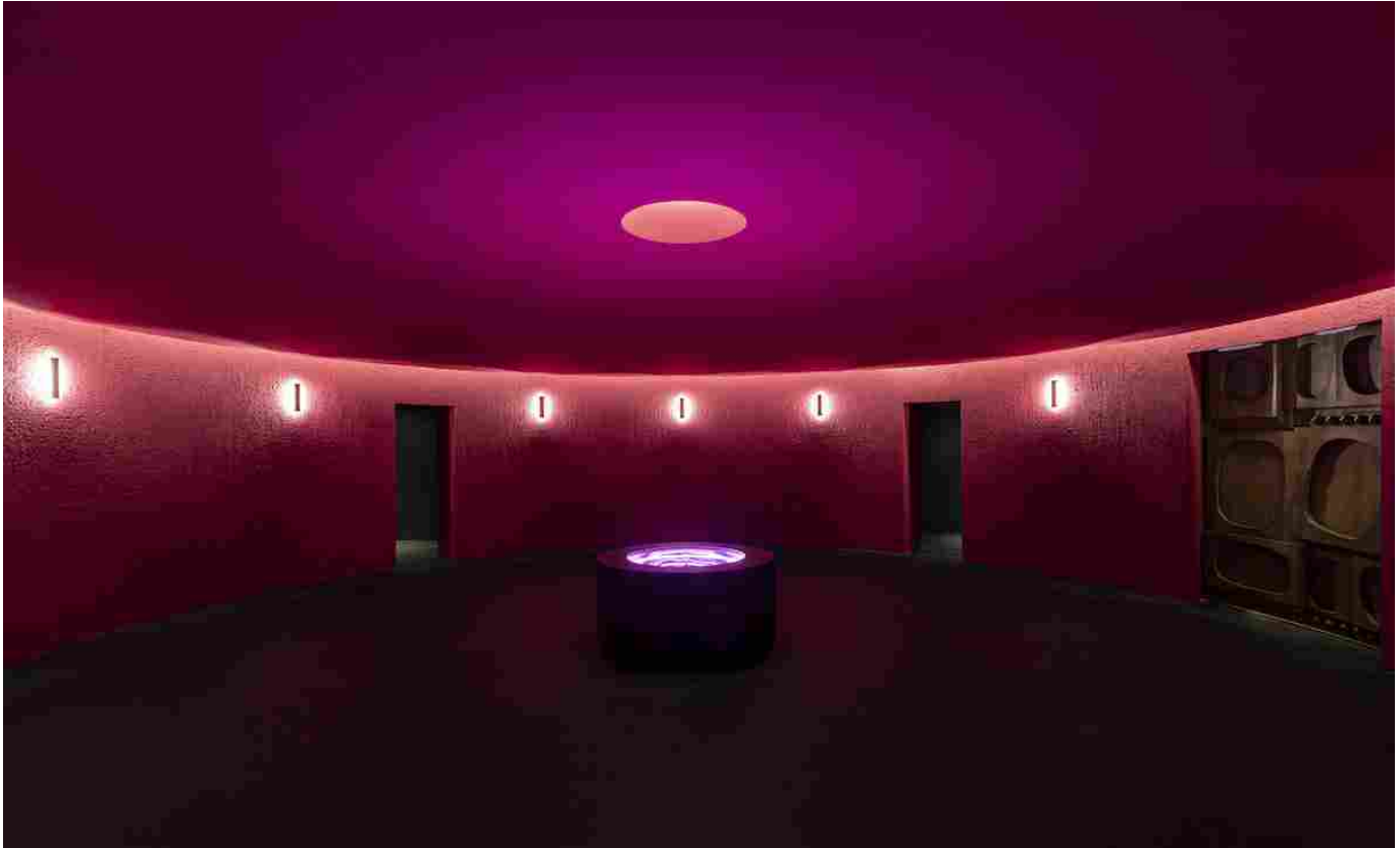
Cupola dei sensi