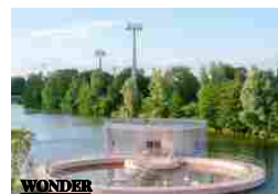
ART PAVILION M.