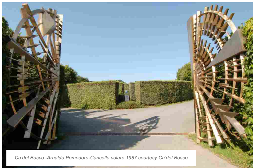
Ca' del Bosco -Arnaldo Pomodoro-Cancello solare 1987 courtesy Ca' del Bosco

cultura e la società, ma soprattutto per illustrare la sua concezione di creatività e ingegno, preservando nel tempo una chiara visione. Senza necessariamente guardare ad un eventuale tornaconto economico – anzi, i musei d'impresa implicano spesso un notevole investimento di risorse e pochi ritorni immediati – bensì per il piacere di narrare una storia, una passione, un'idea, una vita – condividendola con il pubblico per farne non solo brand identity, ma anche sapienza e coscienza comuni.