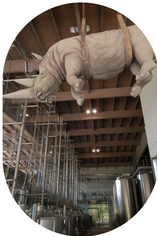
Sospeso, de Stefano Bombardieri, em Ca'del Bosco