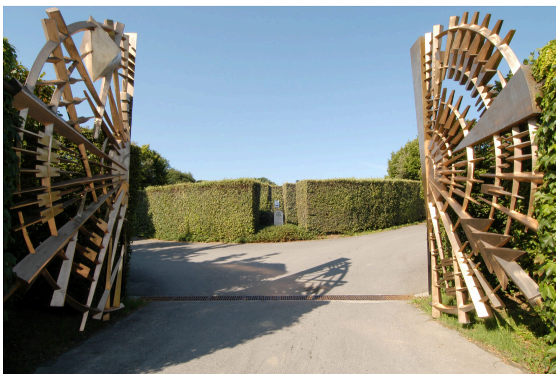
Portão de entrada da empresa Ca'del Bosco com obra do escultor Arnaldo Pomodoro

Arnaldo Pomodoro, considerado o maior escultor contemporâneo da Itália, criou a imponente escultura Cancellò Solare, que marca a entrada da vinícola. A peça, uma enorme estrutura circular com raios que simbolizam o sol, é um tributo ao papel essencial da luz solar na maturação das uvas.