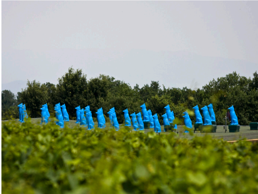
Blue Guardians