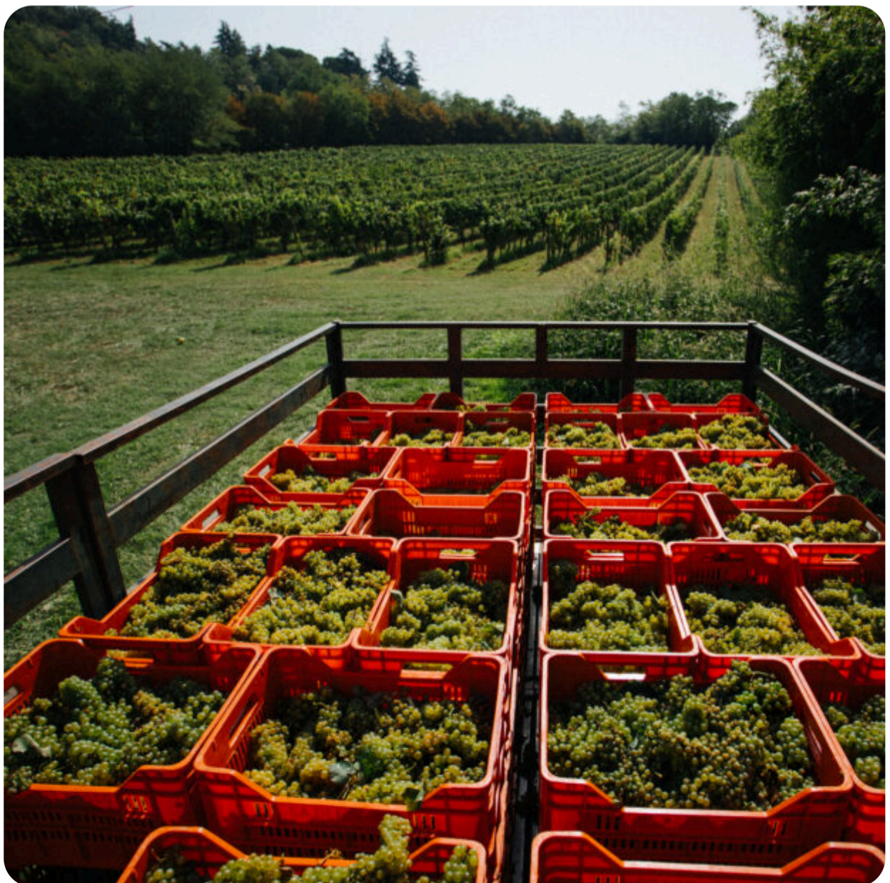
Ca'del Bosco.