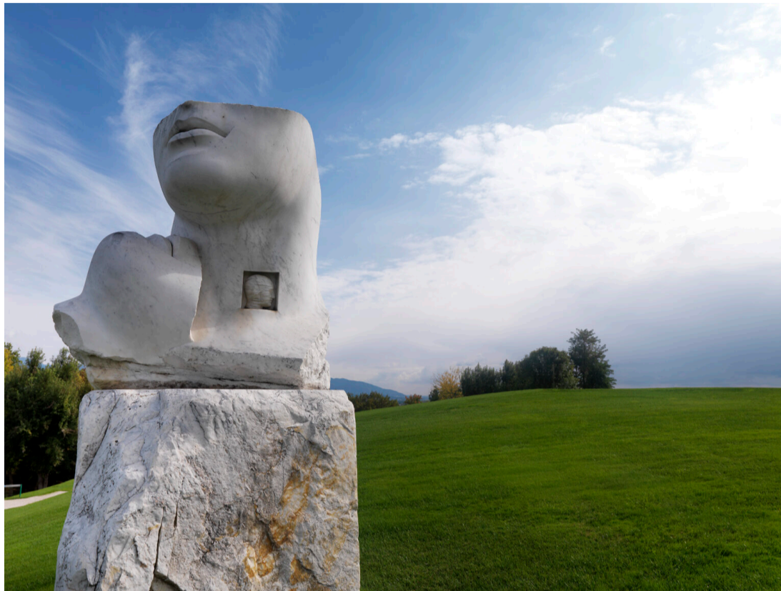
Eroi di Luce, de Igor Mitoraj, em Ca'del Bosco.