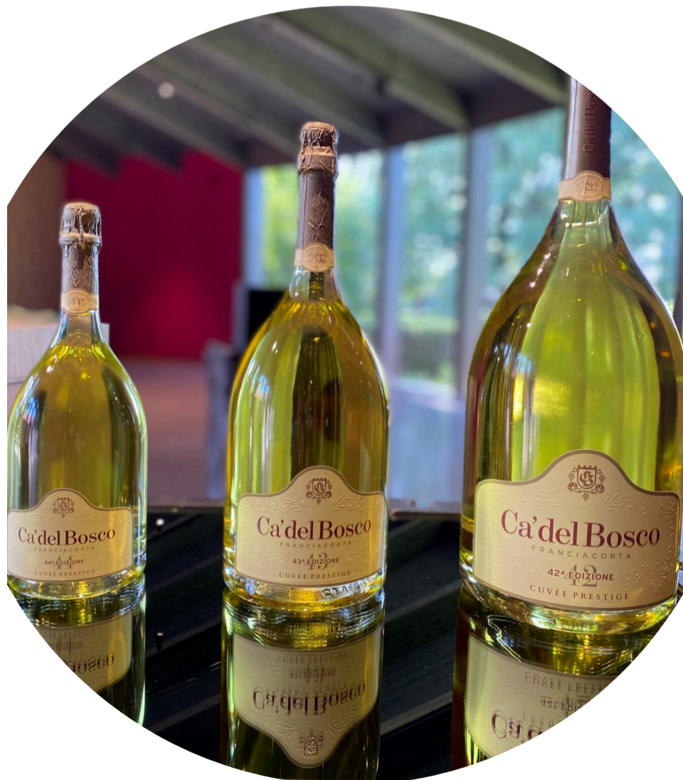
Ca'del Bosco.

O Ca'del Bosco Franciacorta é um dos mais reconhecidos internacionalmente e pode ser encontrado em mercados ao redor do mundo, incluindo o Brasil. Vinhos como o Cuvée Prestige e o Annamaria Clementi são a expressão máxima do terroir de Franciacorta, caracterizados por uma finesse vibrante e um equilíbrio perfeito entre frescor e complexidade.